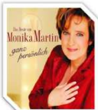
Weltstar Monika MARTIN

Ziel vom Benefizverein: 230.000 Euro Spendengelder zu erreichen.