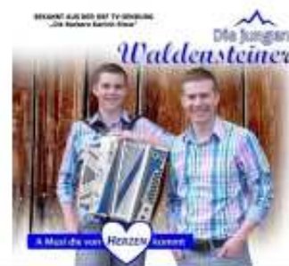
Die Top Aufsteiger des Waldviertels

Karten nur im Vorverkauf erhältlich (Kartenpreis: € 18,-/Kinder bis 15 Jahren € 10,-) Karten erhältlich bei der Marktgemeinde Waldhausen, beim Clubwirt Martin Huber (Rappoltschlag), im Gasthaus Wagner (Oberrondorf) und in der Sparkasse Zwettl