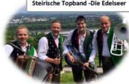
Steirische Topband -Die Edelseer